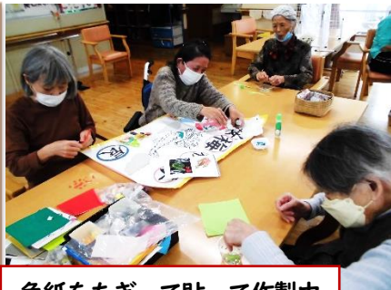
色紙をちぎって貼って作製中